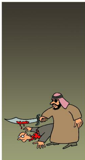
moord in het consulaat

Mensen zijn gelijkwaardig en verdienen gelijke kansen. Wereldwijde humaniteit en solidariteit gaan altijd uit boven nationalisme en de angst voor het onbekende.