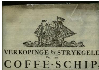
Verkoping van een kofschip in Workum, 1801.

De schepen waar hij op voer waren kofschepen, waarmee hij langs de kusten naar Engeland, Noorwegen, Letland en Zuid-Frankrijk voer. Het meest voer hij op het kofschip Anna en Catharina van Harlingen met kapitein Broer Rimkes (Remkes) de Vries 2 . Kofschepen trof men van de zeventiende tot in de negentiende eeuw in alle havens van de Noord- en Oostzee en de Middellandse Zee. Ze hadden een grote laadcapaciteit.