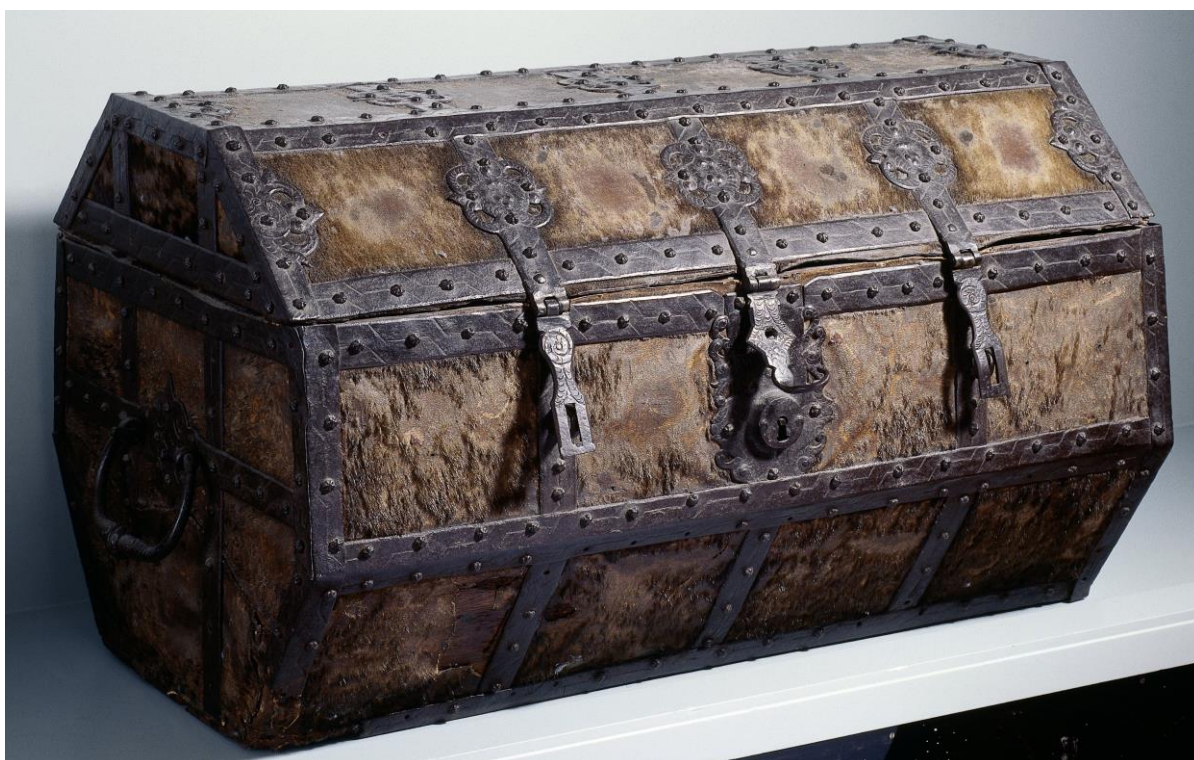
Koffer van eikenhout, bekleed met een zeehondenbuis en beslagen met ten dele tot eenvoudige ornamenten uitgesmeed ijzer. De koffer is achthoekig, heeft een slot en twee overvallen voor hangsloten en twee hengsels aan de smalle kanten. Binnenin twee schotten. Afm. 50 cm x l. 95 cm x d. 54 cm, Rijksmuseum Amsterdam, invnr. NG-NM-6079.

De zeekist werd en wordt ook wel zeemanskist genoemd. In het Rijksmuseum te Amsterdam is een zeer fraaie met zeehondenbuis beklede zeemanskist uit de achttiende eeuw.