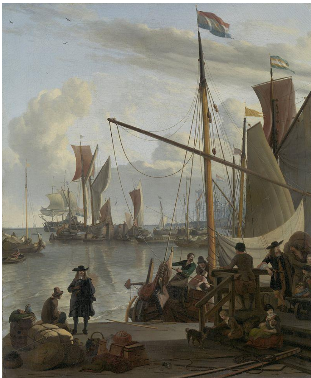
Het IJ te Amsterdam, gezien vanaf de Mosselsteiger. Ludolf Bakhuizen (1631-1708), 1673. Olieverf op doek, h. 81 cm, br. 67 cm. Rijksmuseum Amsterdam, invnr SK-A-9.

Op een schilderij van Ludolf Bakhuizen uit 1673 in het Rijksmuseum te Amsterdam is in het midden op de voorgrond een zeekist afgebeeld. De kist kon dienen als zitbank en bevatte de persoonlijke zaken van de zeeman. De wanden van de afgebeelde kist lopen naar boven naar binnen toe, waardoor het zwaartepunt lager ligt en de kist niet makkelijk kan omkiepen. Aan de korte zijden zijn handvaten bevestigd en de kist kon op slot.