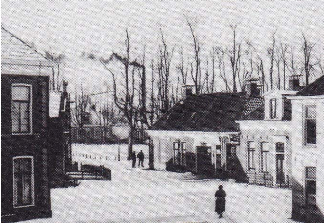
1924: Doorkijk van het Noord naar de Terp. Het tweede huis rechts is de bakkerij. Het plaatje is een uitsnede van een foto gemaakt door Kees Gorter (in: Bokma en Kuipers 1985:60).