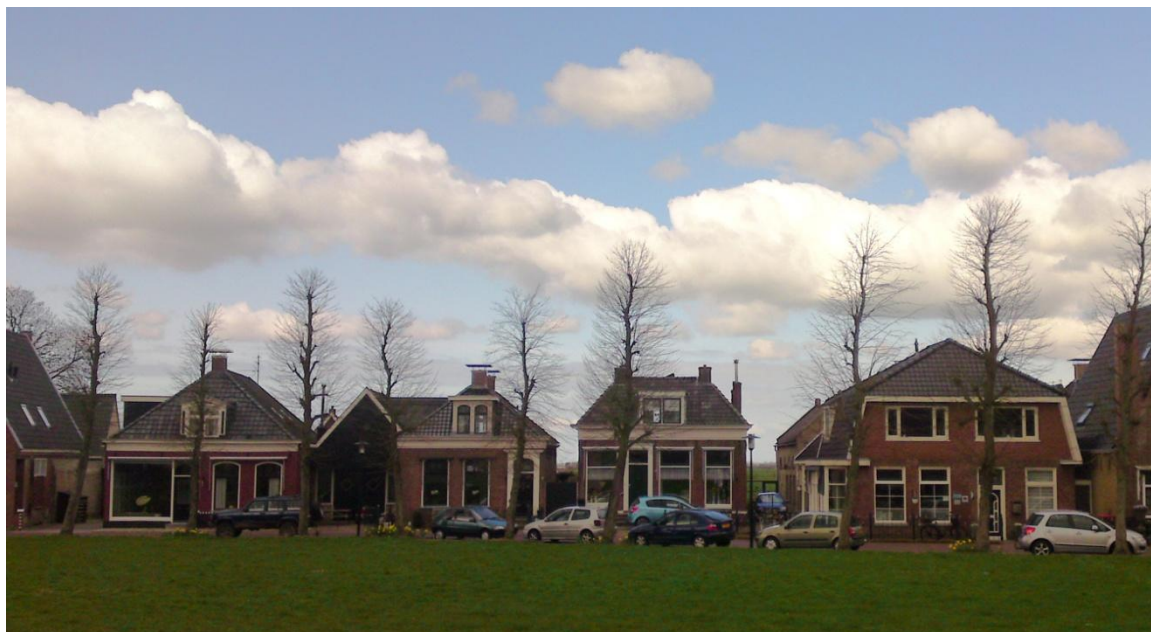
De Terp te Wommels anno 2012, met de Wijde Steeg (links) en rechts daarvan (in het midden van de foto) de vroegere 'smidssteeg'