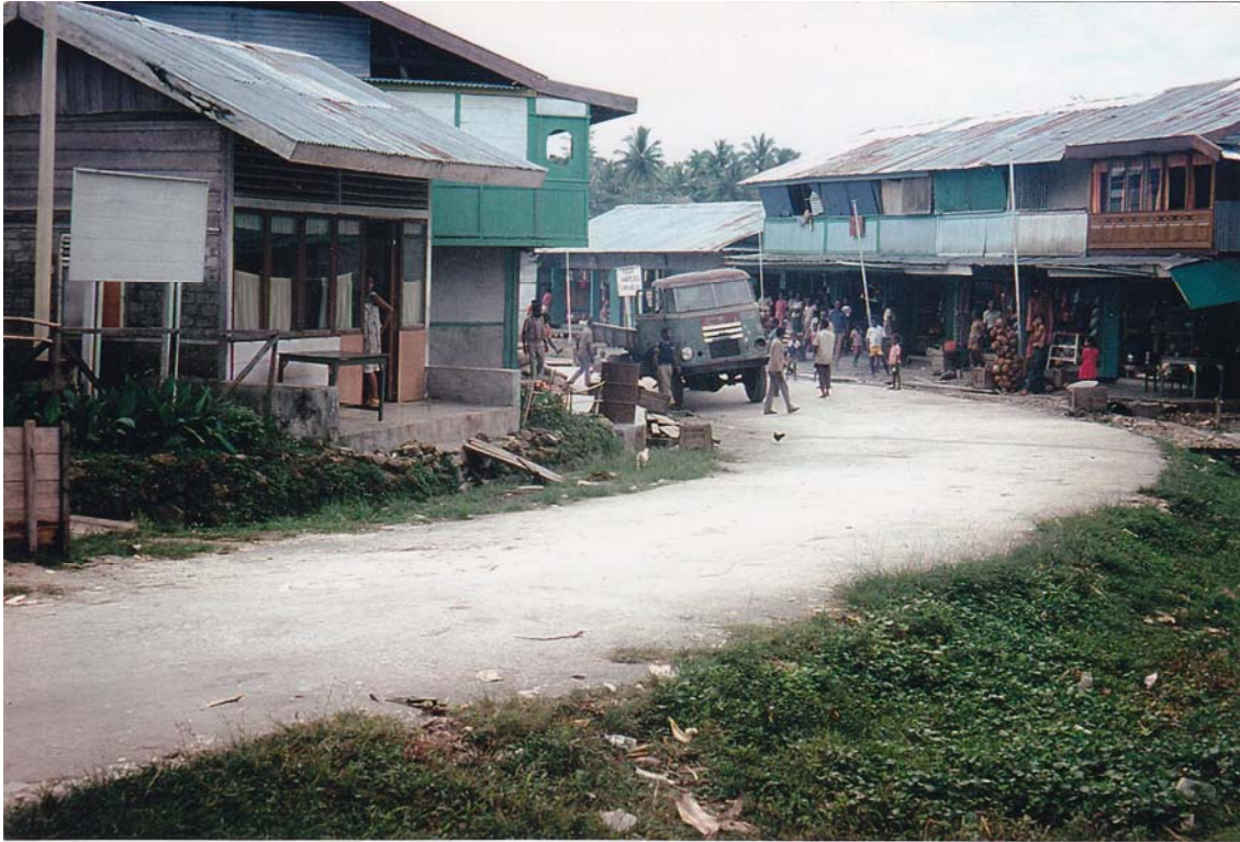
De lêste DAF op Nij-Guinea (Teminabuan 1975)