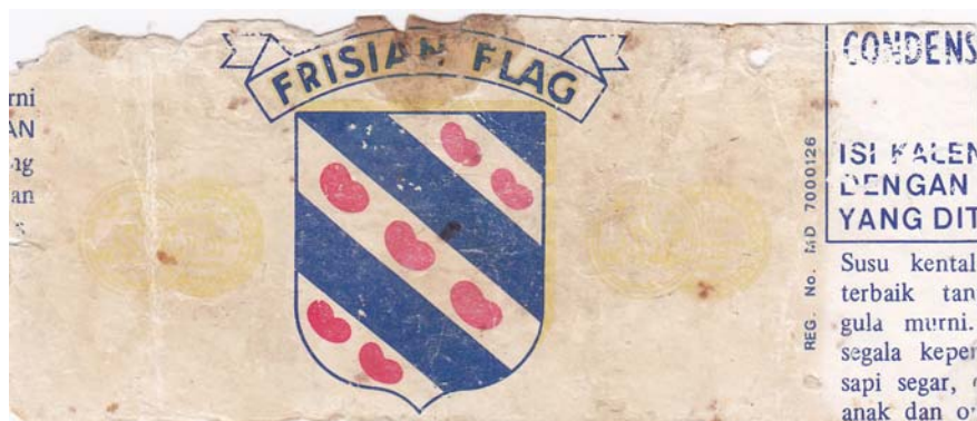
De 'Frisian Flag' yn Teminabuan (1975)