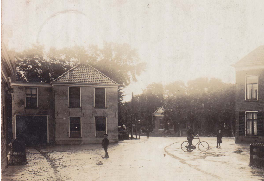
Links de herberg op de noordzijde van 't Noord in het begin van de vorige eeuw (perceel kadaster nr. 58 in 1832; de foto is uit een album van w. Freerk van der Bos).