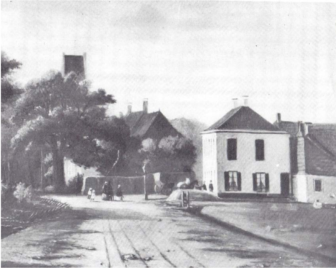
Rechts de herberg op de Noordzijde van 't Noord, in het midden het Sminiahuis (ca. 1860) . Deel van een schilderij, rond 1985 in bezit van een familie in Arnhem (uit: Bokma en Kuipers 1985:39).