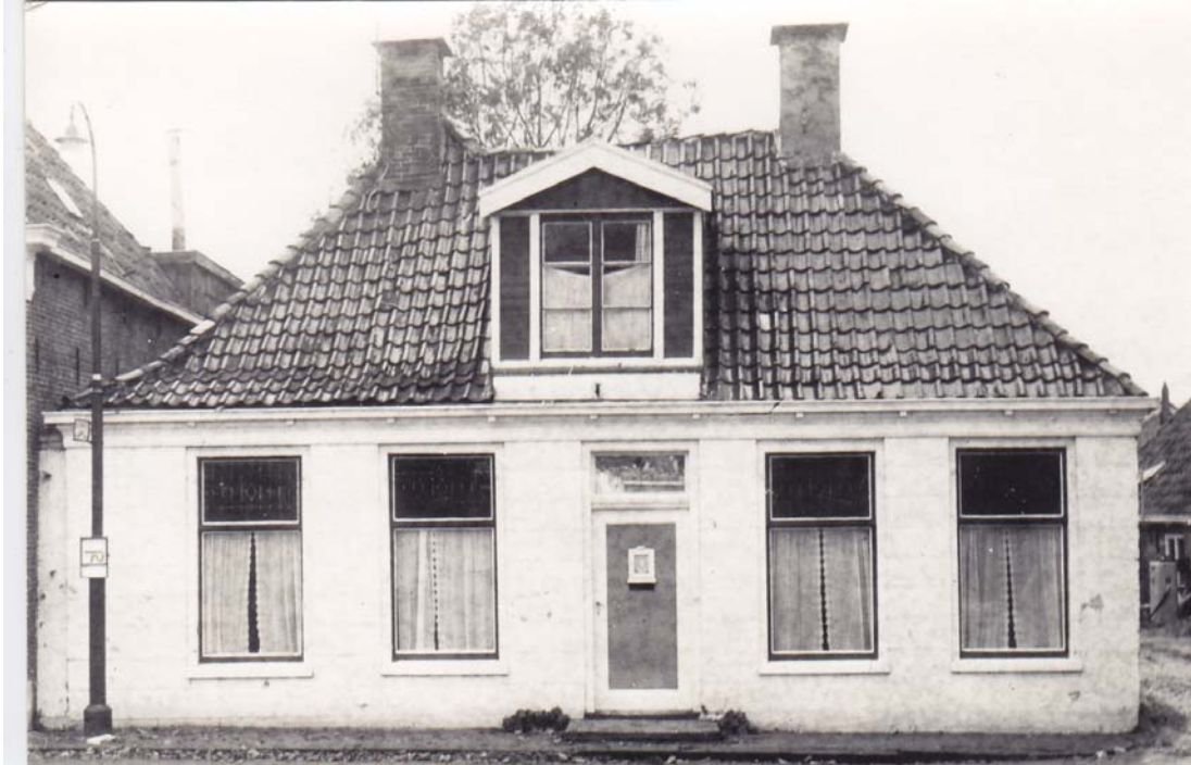
Het huis op het noordwesten van t' Noord, afgebroken in 1969 (perceel kadaster nr. 56 in 1832).