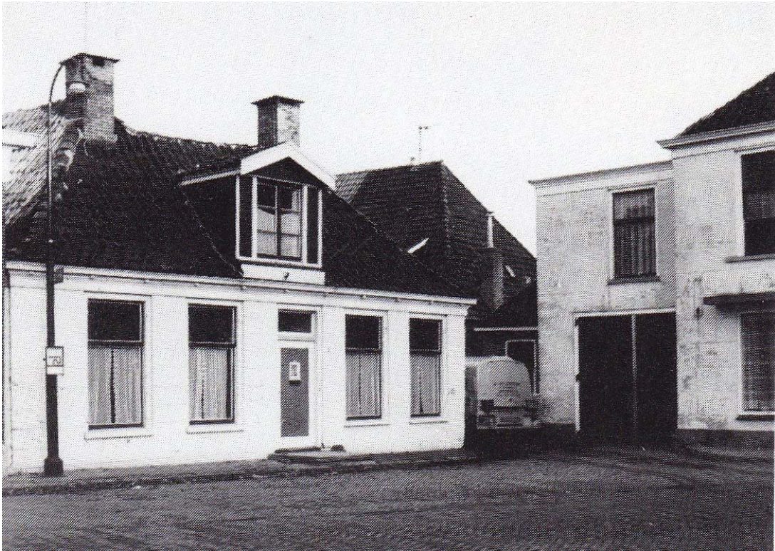
Links het huis op de noordwestzijde van het Noord, met voorheen aangebouwd aan de achter- of westzijde nog een ander huis; in het midden de ingang naar de 'Klompebuurt'; rechts de voormalige herberg, van na 1832, op de noordzijde van het Noord.