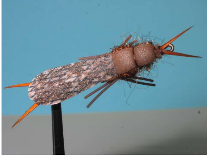
Gebonden en foto: Ad Hoogenboezem

Deze foto toont een volwassen steenvlieg met vleugels. Verderop nog een foto van een nimf.