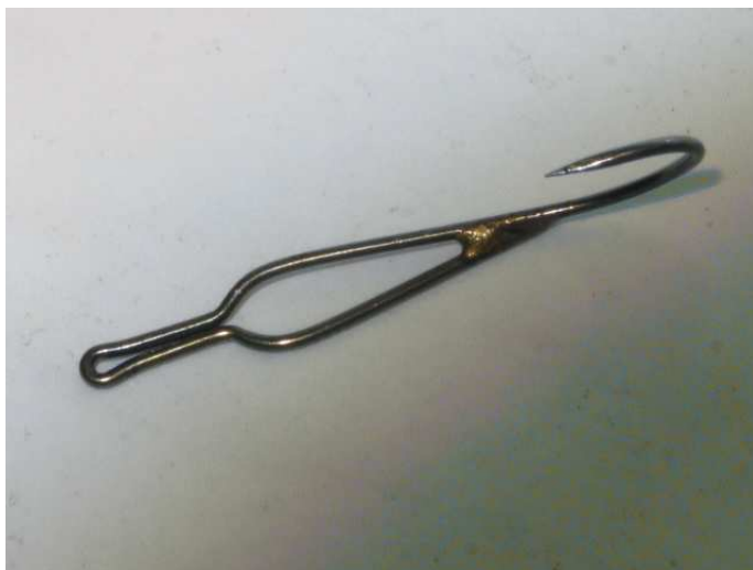
Model II

Het is niet bij een ieder bekend, dat er twee soorten Draper haken zijn geproduceerd. De bovenste foto geeft een afbeelding van de eerste serie. Foto twee geeft de verbeterde versie aan. Deze haken zijn in mijn bezit en ik gebruik ze beide. Helaas uit productie genomen, zoals zoveel mooie speciale haken !