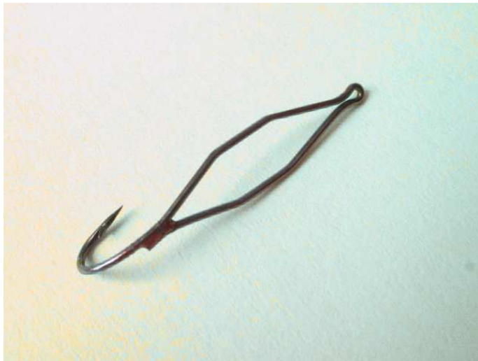
Model I