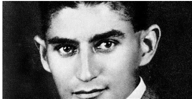
Franz Kafka (1883-1924)

nahme der ersten Sätze Kafkas im Schreiben eines Gegenwartsautors wie Christoph Ransmayr, um nur einige Beispiele zu nennen.