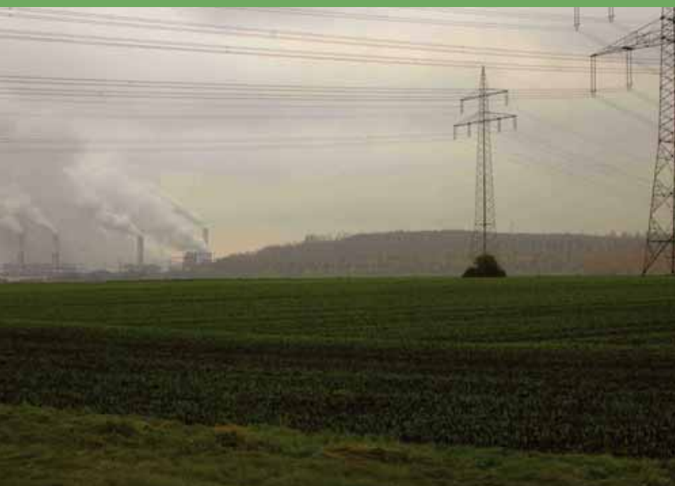
Vaak was Jo te vinden bij de Vollrathhöhe, de kunstmatige hoogte op de achtergrond.