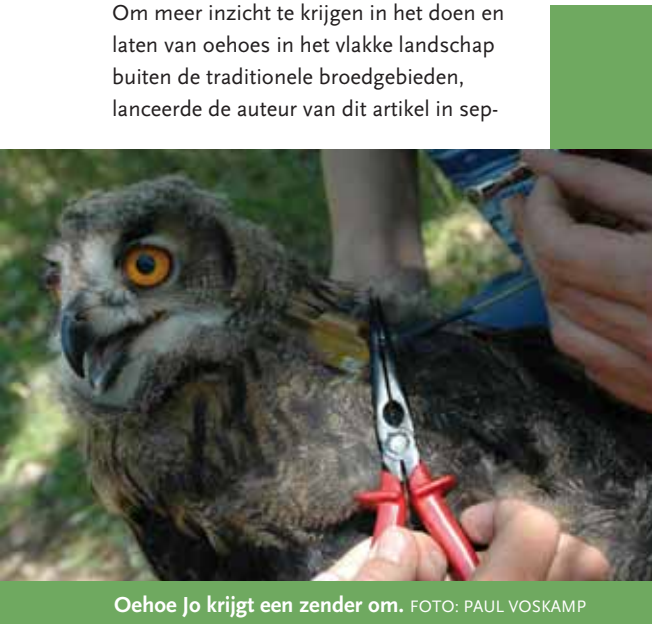
Oehoe Jo krijgt een zender om.

Zowel in Gelderland als in Limburg vingen we met de hand een zeven weken oude oehoe. Ze zijn op die leeftijd al behoorlijk uitgegroeid, maar kunnen nog net niet vliegen. De GPS-zenders werden door een expert van SOVON als een rugzakje op de rug bevestigd en hadden een gewicht van veertig gram (zo'n twee procent van het