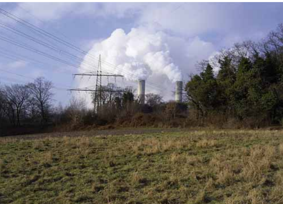
Extensief grasland bij de zuidwestpunt van de Vollrathhöhe. In deze omgeving is de oehoe veelvuldig gepeild.

Gejo Wassink is actief in de Werkgroep Roofvogels Nederland en steekt alle vrije tijd in het bestuderen van de oehoe. Hij publiceerde al eerder hierover in Natura 2006/1.