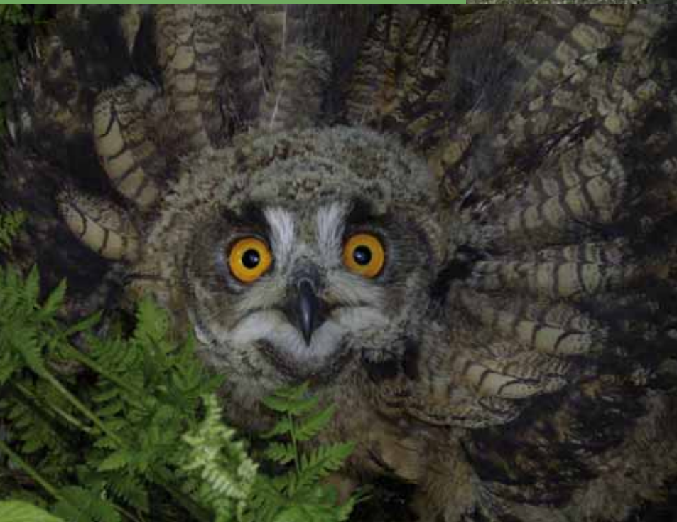
Links: Jonge oehoe.

lichaamsgewicht). De uilen werden één keer per nacht gepeild, opdat de ingebouwde batterij ongeveer een jaar lang mee zou kunnen gaan.